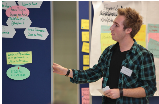
Vorstellung der Ergebnisse des Workshops 2 vor dem Plenum