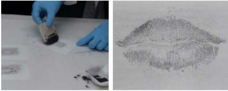
Kontrastierung eines latenten Lippenabdrucks mittels Magnetpulver.

Die Ausprägung der Struktur der Lippenfurchen und damit die Qualität der Abdrucks, hängt zum einen stark vom Anpressdruck sowie der Haltung des Mundes, zum andere von der