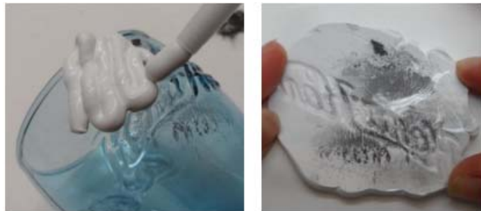
Kontrastierung eines latenten Lippenabdrucks mittels Magnetpulver, Sicherung mit AccuTrans.

Experimente mit unterschiedlichen Spurenträgern haben gezeigt, dass die polizeilich zugelassenen und bewährten Materialien, wie Magnetpulver, Spurensicherungsfolie und AccuTrans, gut geeignet sind um qualitativ hochwertige Spurensicherung zu betreiben. Eine qualitativ hochwertige Fotodokumentation sowohl des Originals und der gesicherten Spur, als auch der Vergleichsproben, ist hier von höchster Bedeutung und unabdingbar für eine detaillierte Auswertung des Furchenmusters.